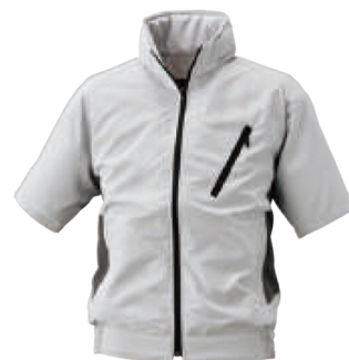
68 (シルバーグレー×ダークグレー)