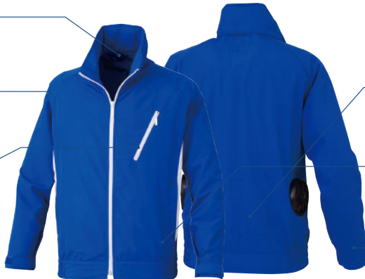
53 ロイヤルブルー×ホワイト