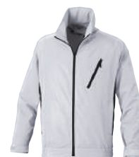
68 シルバーグレー×ダークグレー