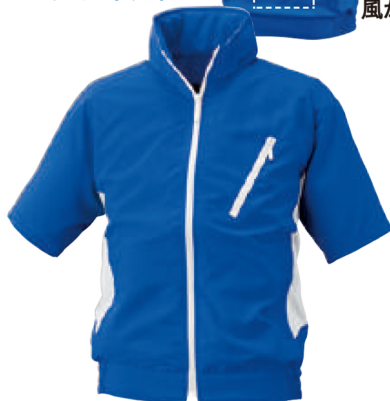
53 (ロイヤルブルー×ホワイト)